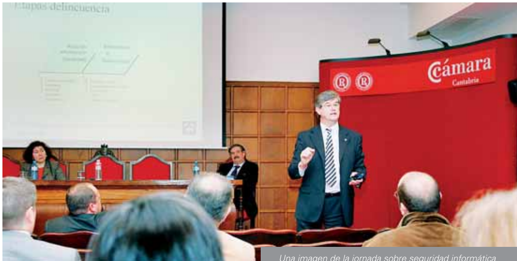
Una imagen de la jornada sobre seguridad informática celebrada en la Cámara en febrero