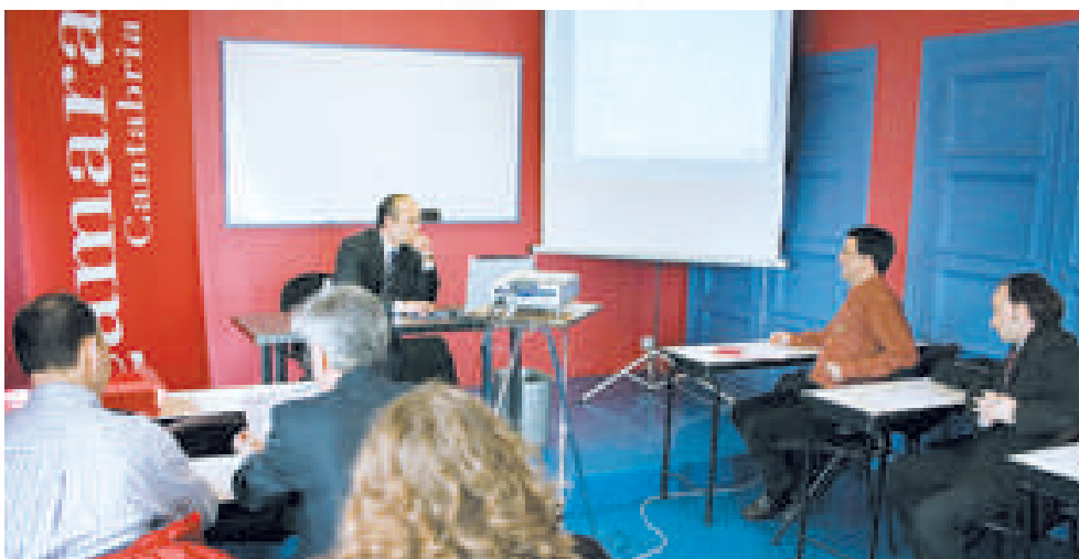
Empresas de Cantabria se reunieron en la Cámara antes de viajar a China en misión comercial