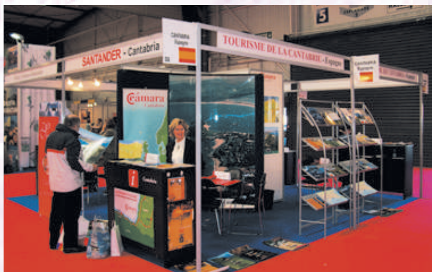
Stand de la Cámara de Cantabria en el Salon du Tourisme de Toulouse