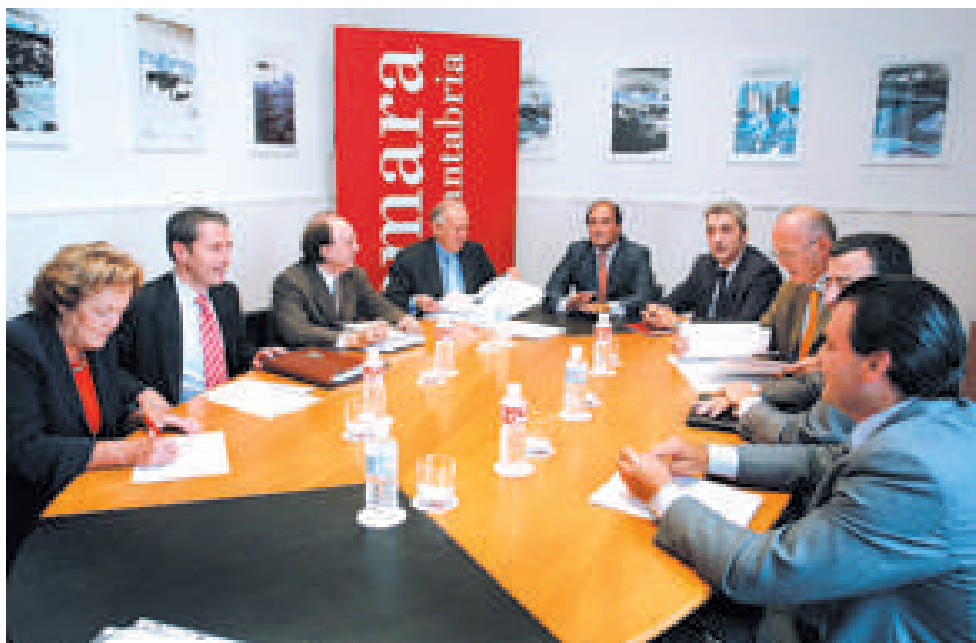
Representantes institucionales abordaron el contenido del PPX para 2006