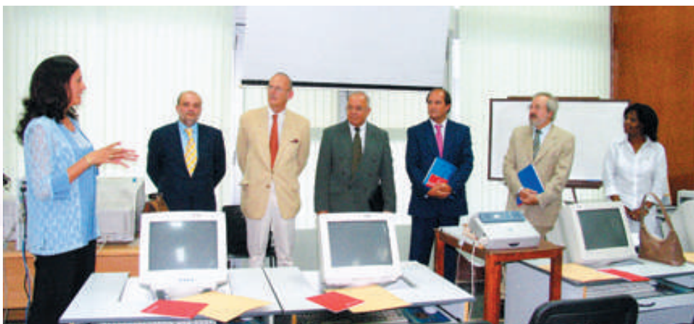
Organizadores y ponente del seminario impartido en La Habana

Ésta es la segunda ocasión en que la Cámara de Cantabria imparte un seminario en Cuba. En 2004, un grupo de técnicos cubanos recibió un curso de formación general en materia de comercio exterior, que sirvió de ventana a través de la cual los técnicos cubanos pudieron conocer cómo funciona el comercio exterior en el mundo.