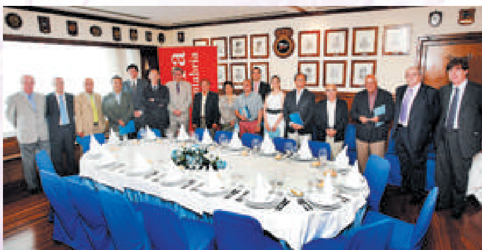
Empresarios, representantes chilenos y camerales, reunidos en Santander