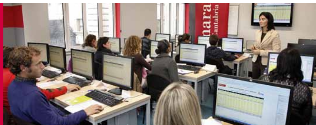
ALUMNOS EN UNA DE LAS JORNADAS ORGANIZADAS POR LA ENTIDAD CAMERAL EN 2010.

El 86,13% de los alumnos que participaron en las actividades el pasado año tiene una valoración buena o muy buena de ellas