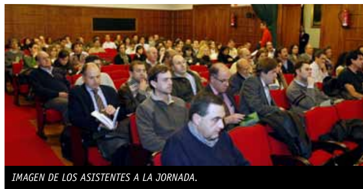
IMAGEN DE LOS ASISTENTES A LA JORNADA.

La acción formativa, enmarcada en las actividades del Foro Empresarial de Medio Ambiente, estuvo patrocinada por la Consejería de Medio Ambiente y la CEOE