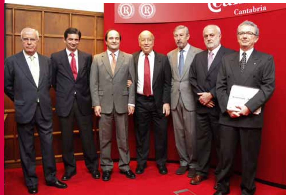
EL PRESIDENTE DE LA CÁMARA JUNTO A LOS PRESTIGIOSOS ABOGADOS QUE PARTICIPARON EN LA JORNADA.