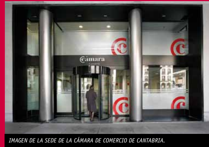
IMAGEN DE LA SEDE DE LA CÁMARA DE COMERCIO DE CANTABRIA.

M ás del 80% de los usuarios de los servicios que ofrece la Cámara de Comercio de Cantabria tienen una imagen positiva o muy positiva de la institución regional, debido principalmente a una correcta atención del personal y una información y asesoramiento de calidad. Así se recoge en la encuesta anual realizada a lo largo de 2010 a los usuarios mediante correo electrónico, cumpliendo así con la certificación de calidad de las normas ISO 9001:2008 y 14001:2004 implantadas en la entidad. ■