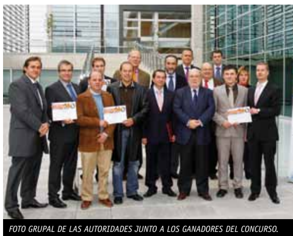
FOTO GRUPAL DE LAS AUTORIDADES JUNTO A LOS GANADORES DEL CONCURSO.

empresa Smart Sensor Technology, por un proyecto de detección de contaminación por hidrocarburos en estaciones de servicios. Los demás galardones del certamen fueron para Argos IDI, Equissec, Aquamanager y Sadiq Engineering, que recibieron el segundo, tercer, cuarto y quinto puesto, respectivamente. La Cámara es colaboradora de este concurso. ■