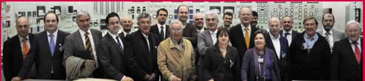
LOS INTEGRANTES DEL PLENO CAMERAL EN SANTA MARÍA DE GAROÑA.

Con esta visita se ha querido trasladar el apoyo cameral al desarrollo de la energía nuclear e informarse de primera mano de las ventajas de esta fuente