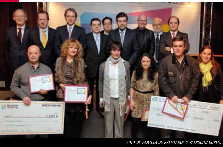
FOTO DE FAMILIA DE PREMIADOS Y PATROCINADORES.

rrasa. También asistieron gran número de representantes de las diferentes asociaciones de comerciantes de la ciudad. La 33ª edición del concurso ha contado con el patrocinio del Ayuntamiento de Santander, Caja Cantabria, la Agrupación de Comerciantes del Centro de Santander, la Asociación de Comerciantes del Casco Viejo y Ensanche de Santander, la Federación de Asociaciones Empresariales de la Distribución y el Comercio de Cantabria (FEDISCOM) y Santander Shopping, que se ha incorporado este año al grupo de patrocinadores del certamen. Además ha contado con el apoyo de diversos medios de comunicación, en concreto, de Radio Santander, El Diario Montañés, Radio Altamira Grupo Rabel, Cadena COPE y Onda Cero. ■