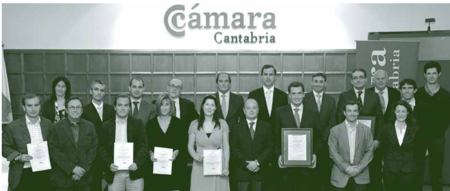
Nueve empresas que gestionan la información de manera segura recibieron su certificado ISO 27001 en la Cámara.