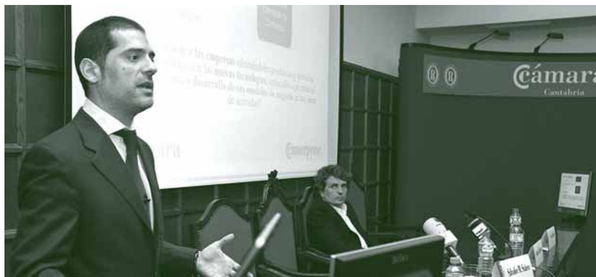
Camerpyme protagonizó una jornada en la Cámara en la que se abordó el presente y el futuro del proyecto.