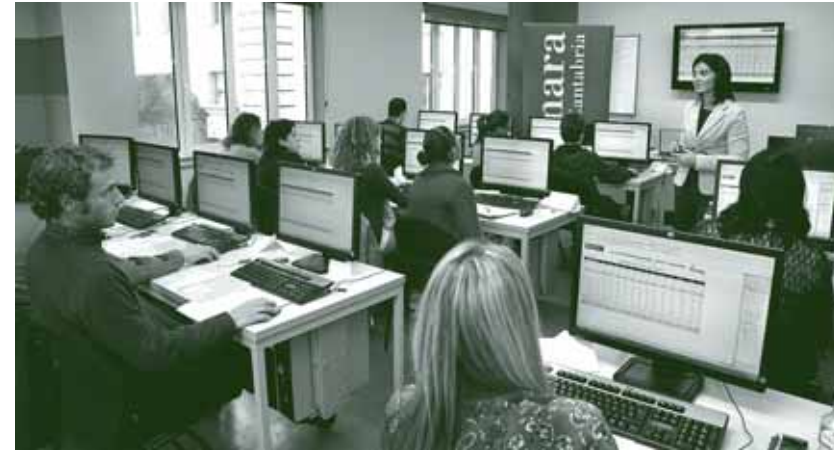
En 2009 se inauguró el Aula de Informática de la Cámara.

En 2009, se desarrollaron las siguientes aplicaciones para la Intranet corporativa y para otras áreas camerales: