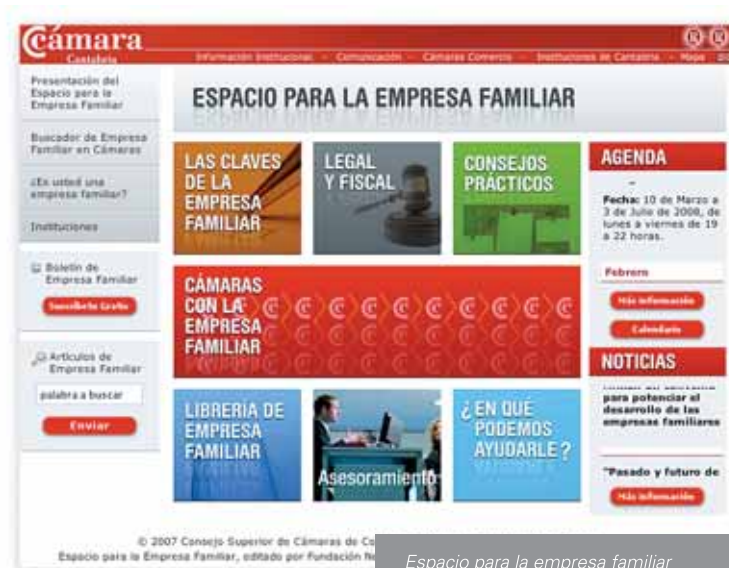
Espacio para la empresa familiar

Para su elaboración y mantenimiento las Cámaras cuentan con el soporte de la Fundación Nexia, la única institución sin ánimo de lucro, dedicada a la formación de la familia empresaria y la empresa familiar en España.