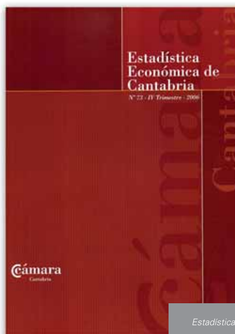
Estadística Económica de Cantabria

Con la puesta en marcha y posterior desarrollo del Instituto Cántabro de Estadística (Icane), creado en 2004, la elaboración y sistematización de la estadística regional ha sido superada por este organismo y se encuentra a disposición de todos los ciudadanos en su página web www.icane.es , por lo que la Cámara consideró que no tenía sentido dedicar esfuerzos a duplicar un trabajo que ahora realiza la Administración regional y decidió dejar de editar esta publicación.