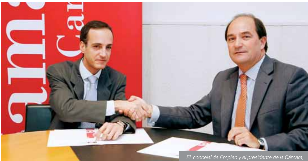
El concejal de Empleo y el presidente de la Cámara, tras la firma del convenio

La Cámara de Comercio de Cantabria y el Ayuntamiento de Santander firmaron en abril un convenio de colaboración por el que la institución cameral cede al Centro de Documentación de la Imagen de Santander (CDIS) su archivo fotográfico para ser digitalizado y conservado en este centro, que podrá difundirlo citando la procedencia.