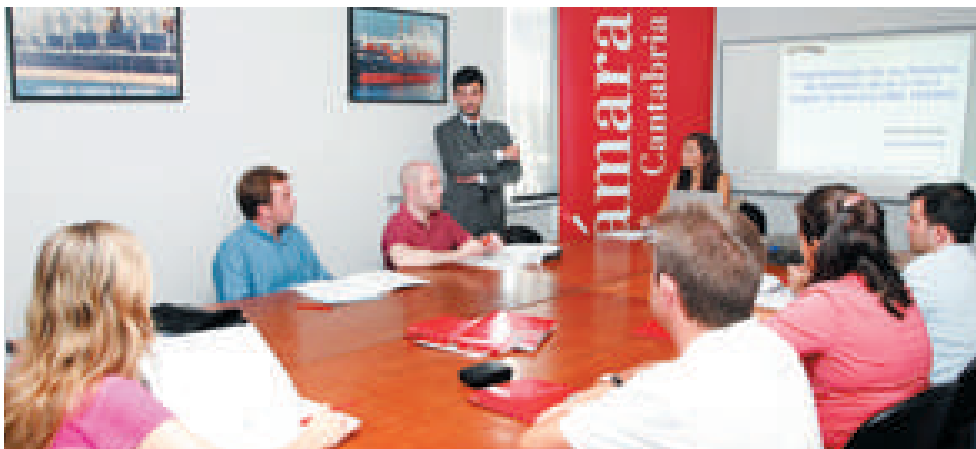
Una imagen del primero de los seminarios impartidos dentro del proyecto "R+D+I para pymes," dedicado a la norma UNE166002

El IRC Galactea realizó además las siguientes tareas: