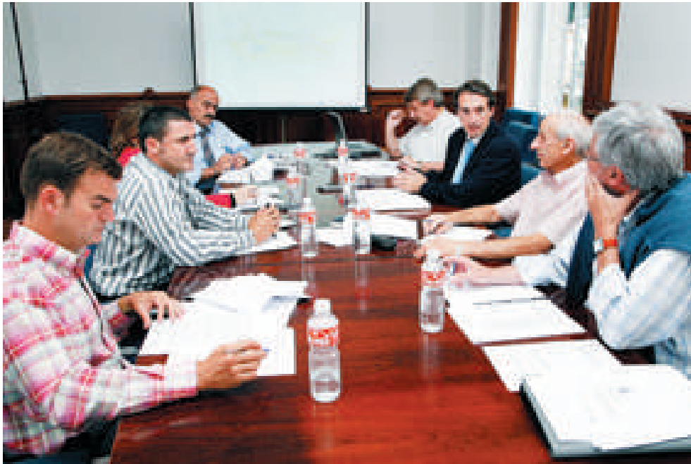
Primera reunión del Consejo Municipal de Sostenibilidad, al que pertenece la Cámara de Cantabria