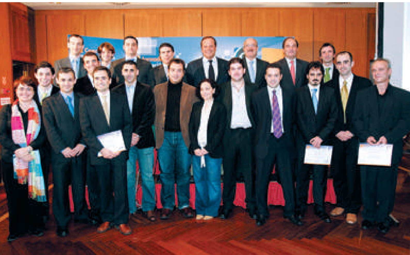
Ganadores y organizadores del concurso, tras la entrega de premios

La Cámara ha formado parte del jurado evaluador de estos galardones, que pretenden incentivar la creación de nuevas experiencias empresariales que se sustenten sobre proyectos innovadores de base tecnológica. En esta iniciativa del programa Emprecan de Sodercan y del Plan Regional de I+D+i, colaboran la Consejería de Industria, Trabajo y Desarrollo Tecnológico, Universidad de Cantabria, Caja Cantabria, Cámara de Comercio, CEOE-CEPYME de Cantabria y Ono. En 2006, las empresas galardonadas fueron I-Sensors, Vista Silicon, Aquasenso, GIM Geomatics, Iberobotics y Arcanos Intercom.