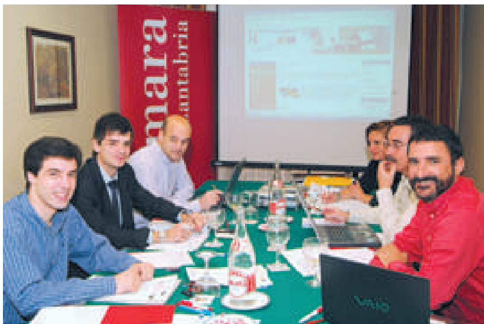
Representantes de las entidades que participan en el proyecto "R+D+I para pymes," reunidos en Santander