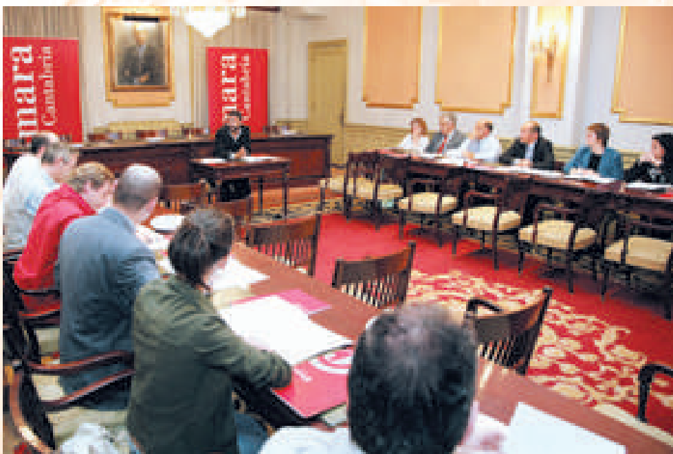
Empresas integrantes del Foro Empresarial de Medio Ambiente, reunidas en la Cámara

Con la firma de este convenio, ambas instituciones coinciden en su actuación de apoyo a las industrias de la región, en aras a favorecer su competitividad y el cumplimiento riguroso de sus obligaciones de medio ambiente. Tanto la Cámara como la Consejería asumen "el importante papel que el sector empresarial ha de desempeñar en la consecución de un desarrollo económico sostenible para Cantabria así como de las dificultades y oportunidades que dicho reto presenta para las empresas y, en especial, para las que pertenecen al sector industrial, potenciando, como establece el Acta Única Europea, la protección del medio ambiente sin comprometer la competitividad del sector industrial regional".