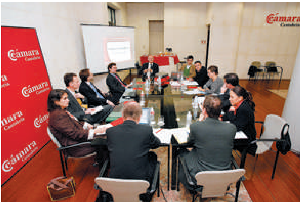
Reunión de los expertos de la OCDE con representantes de la Cámara de Comercio en Santander