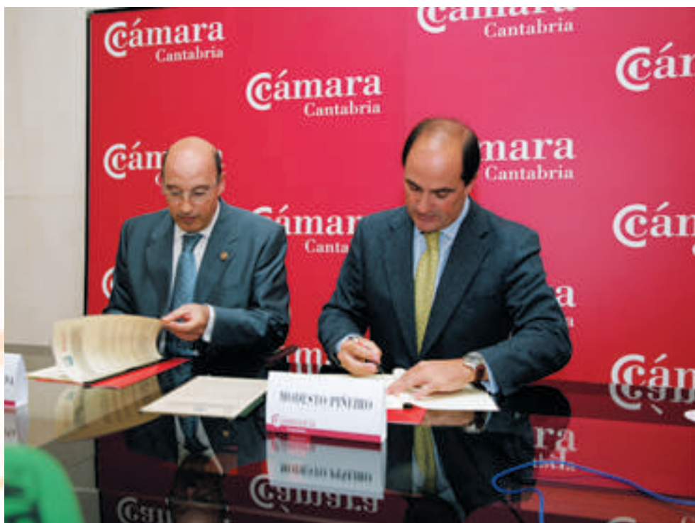
El rector de la Universidad de Cantabria y el presidente de la Cámara de Comercio, en la firma del convenio

La Cámara de Cantabria ha colgado en su página web ( www.camaracantabria.com ) el boletín de noticias electrónico UC/FLTQ (Universidad de Cantabria / Fundación Leonardo Torres Quevedo) para fomentar entre los internautas que la visiten, y especialmente entre el sector empresarial, el conocimiento de las actividades que realizan la universidad y la fundación en sus diferentes ámbitos de trabajo. Esta publicación se enmarca dentro de un convenio marco de colaboración firmado en mayo pasado por la institución cameral y la académica para potenciar y avanzar en las múltiples líneas de cooperación que tradicionalmente mantienen, pero especialmente en el campo de la difusión del conocimiento generado por la institución universitaria entre las empresas.