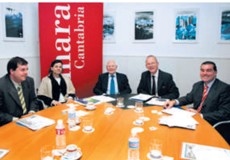
Empresas cántabras reunidas con el embajador de El Salvador