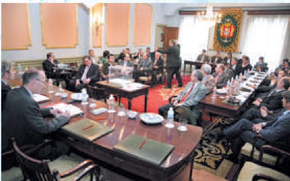
El nuevo Pleno de la Cámara de Cantabria, momentos antes de iniciar la votación para elegir presidente y Comité Ejecutivo

La Cámara de Comercio de Cantabria vivió en 2006 un nuevo proceso electoral que desembocó en la formación de un nuevo Pleno y un nuevo Comité Ejecutivo y en la designación de un nuevo presidente, los tres órganos de gobierno de la institución, después de que la Consejería de Economía y Hacienda del Gobierno de Cantabria publicara el 13 de febrero en el Boletín Oficial de Cantabria (BOC) la convocatoria de elecciones en las dos Cámaras existentes en la región, la de Cantabria y la de Torrelavega.