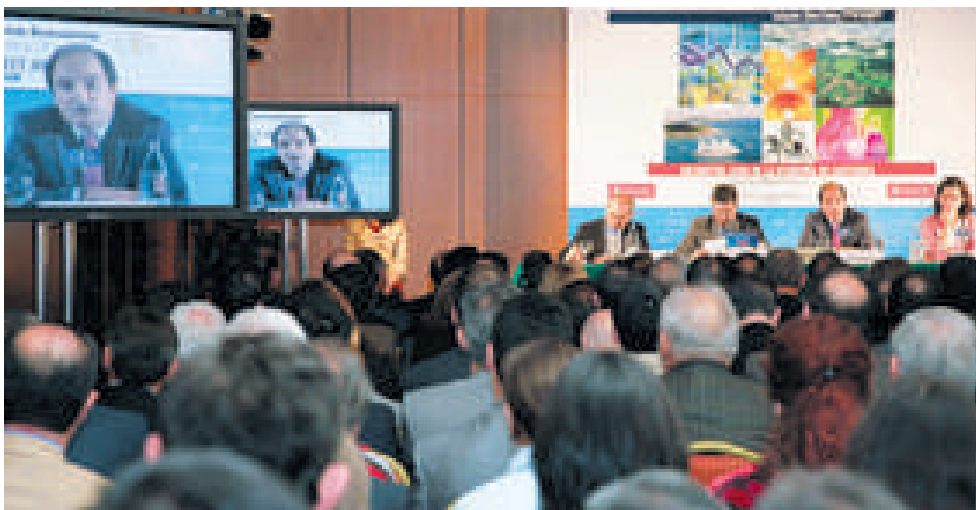
Intervención del presidente de la Cámara de Comercio de Cantabria en el Foro de la Nueva Economía, organizado en Santander por The Wall Street Journal