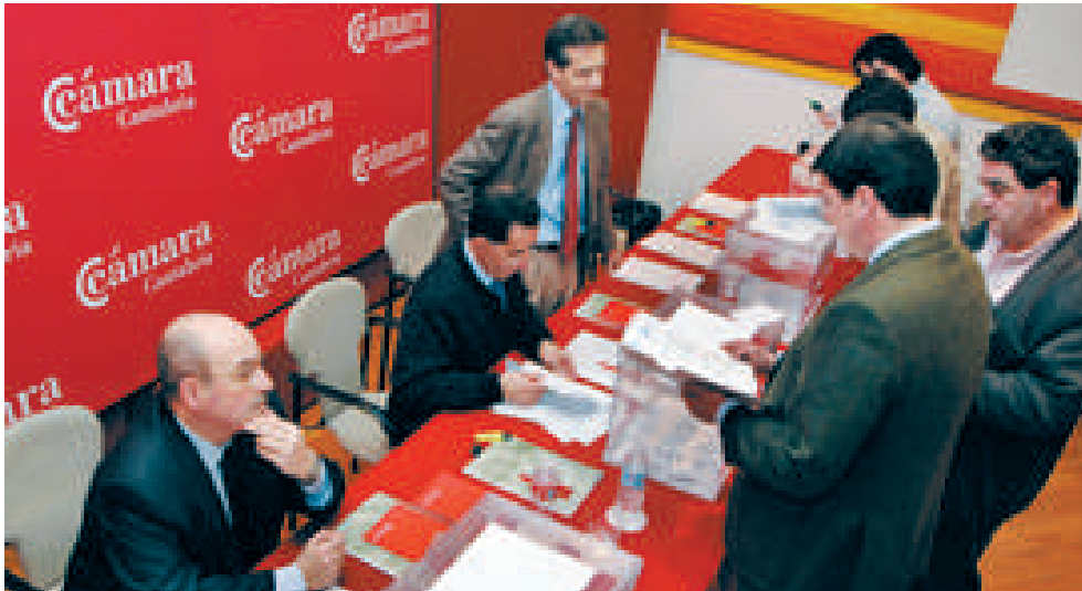
Mesa electoral instalada en la Cámara de Comercio de Cantabria para efectuar las votaciones el 11 de abril

Los siete integrantes del Comité Ejecutivo que resultaron elegidos fueron los siguientes: