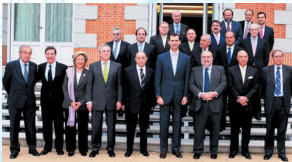
Recepción al Comité Ejecutivo del Consejo Superior de Cámaras por parte del SAR el Príncipe de Asturias en la Zarzuela