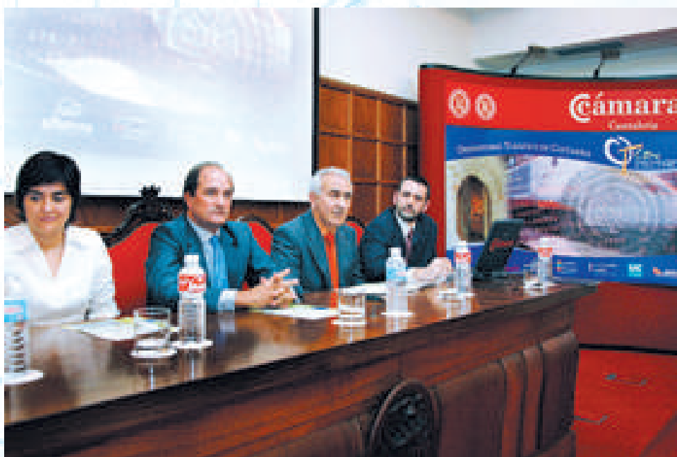
Una imagen de la presentación pública de Observatorio Turístico de Cantabria (Otcán) en la Cámara de Comercio de Cantabria