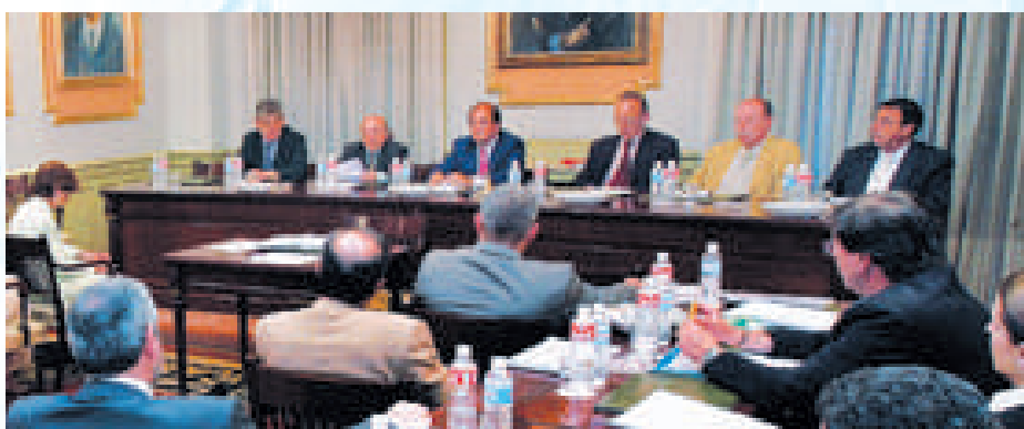
Una imagen del Pleno de la Cámara de Cantabria en el que intervino el consejero de Medio Ambiente