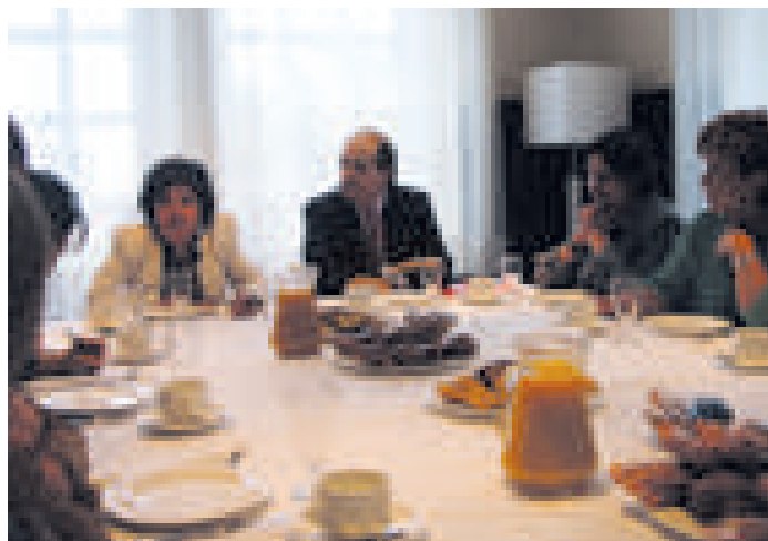
El presidente de la Cámara, en un encuentro con las mujeres empresarias