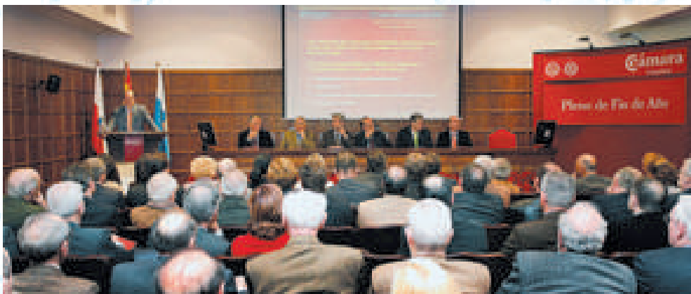
Intervención del presidente en el tradicional Pleno de Fin de Año