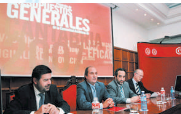
Intervención del consejero de Economía y Hacienda en una sesión plenaria cameral para explicar el contenido de los Presupuestos de Cantabria para 2007