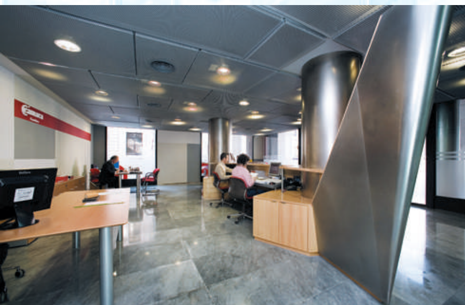
Área de recepción, en la planta baja