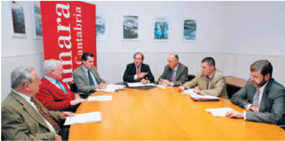
Reunión de la Comisión de Desarrollo Económico e Industria