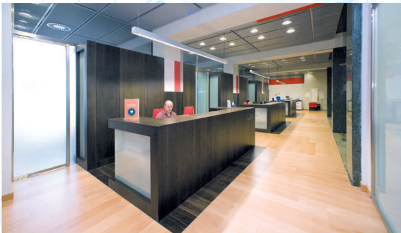
Una imagen de las dependencias reformadas en la segunda planta

La segunda planta, que conserva la zona de Presidencia y Secretaría, ha pasado además a albergar las dependencias de las áreas de Asesoría Jurídica; Industria, Innovación y Medio Ambiente; Comercio Exterior; Comercio Interior y Turismo; y Comunicación. La reforma ha permitido dotar a este espacio de una cómoda sala de reuniones y de incrementar el número de puestos de trabajo, dotándolos de una adecuada infraestructura tecnológica.