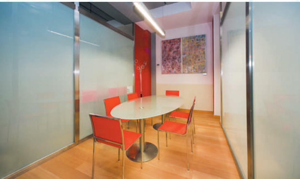
Sala de reuniones