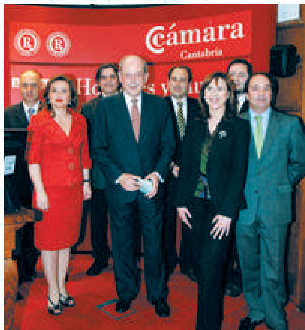
Ponentes y organizadores de la jornada "Cómo ven nuestros hombres y mujeres de empresa la economía de Cantabria para 2006"