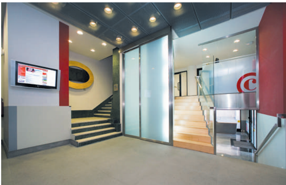
Equipamiento para facilitar el acceso a personas discapacitadas

La obra ha afectado a la planta baja o portal, que ha pasado a convertirse en un espacioso punto de información y recepción, situado a pie de calle, con espacio también para las áreas de Estudios y Creación de Empresas y Administración y Recaudación. Asimismo, esta zona ha dado cabida a una nueva sala multiusos.